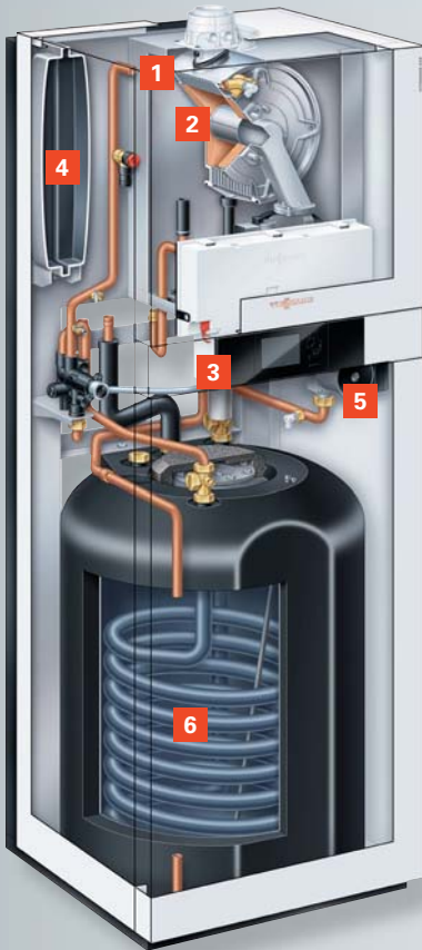
Vitodens 222-F mit emailliertem Rohrwendel-Warmwasserspeicher (Typ B2SA) für Gebiete mit hartem Wasser