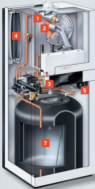
Vitodens 222-F (Typ B2TA) mit emailliertem Ladespeicher