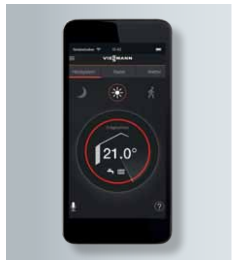
Vitotrol Plus App

Bereits ab Werk verfügt Vitodens 300-W über eine integrierte Internetschnittstelle. Per Vitotrol Plus App lässt es sich vom Smartphone oder Tablet von überall regeln. Heizgerät und DSL-Router können über ein Ethernet-Kabel direkt miteinander verbunden werden.