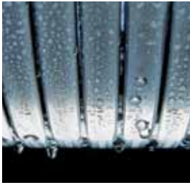
Inox-Radial-Wärmetauscher – langlebig und effizient